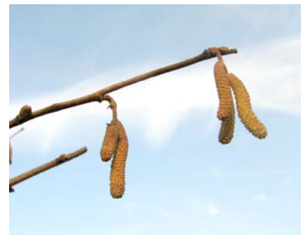
... und die Haselnuss-Männer

Am Wegesrand wuchsen aber einige Kräuter, die mit ihren Blättern oder Blattrosetten überwintert hatten und somit schon zu sehen waren. Gefunden wurden Wiesenlabkraut, Löwenzahn, Schnittlauch, Spitzwegerich, Knoblauchsrauke, Walderdbeere und Nelkenwurz. Die Kinder entpuppten sich als Pflanzendetektive und fanden einzelne Exemplare von gekieltem Lauch (vermutlich), Frauenmantel und Sauerampfer.