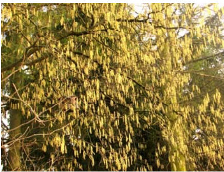
Die ganze Haselnusspracht!

Da sich der Winter erst vor kurzem verabschiedet hatte, waren nur wenige blühende Pflanzen anzutreffen. Ins Auge stieß der Huflattich mit seinen strahlend gelben Blüten - wohl einer der ersten attraktiven Frühlingsblüher. Aber auch die Haselnuss hatte Blüten vorzuweisen. Neben den männlichen Würstchen waren auch die kleinen weiblichen Blüten zu sehen. Sie sind sehr unscheinbar und nur beim genauen Hinsehen lassen sich die roten Narbenfäden entdecken.